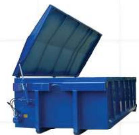
Container mit Deckel