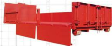
Container mit seitlichen Bordwänden