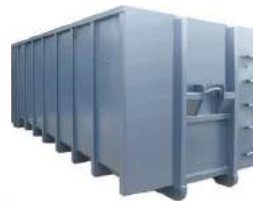
Abrollcontainer 40m 3