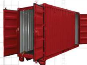
Container mit Seitentür