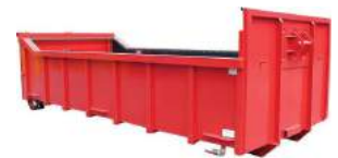
Abrollcontainer mit Pendelklappe